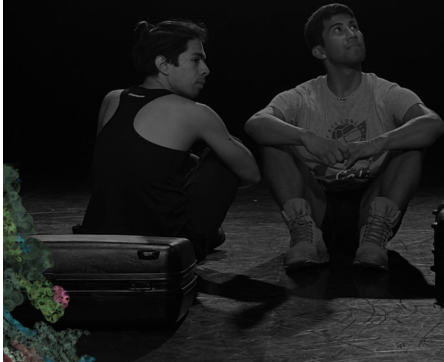
Indolente

Personal técnico y administrativo del Salón de Danza